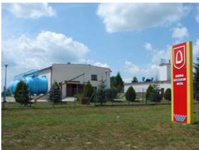
Stacja uzdatniania wody

W ciągu tych 25 lat nasze miasto oraz gmina bardzo się zmieniły, mimo to przed nami stoi jeszcze wiele wyzwań, lecz wierzymy, że tylko wspólny wysiłek i zaangażowanie ze strony całej wspólnoty mogą przynieść oczekiwane przez nas wszystkich zmiany i pożądane rezultaty. Stojąc na progu aplikowania o nowe środki z Unii Europejskiej, a także czekając na wprowadzenie nowych regulacji, które jeszcze bardziej poszerzać będą zakres samodzielności samorządu i upodmiotowienia jego mieszkańców, będziemy się zmieniać i rozwijać. To my decydujemy o tym, jak nam się żyje i jak świadczona jest większość usług publicznych, a sprawnie funkcjonujące samorządy to podstawa zaufania obywatelskiego.