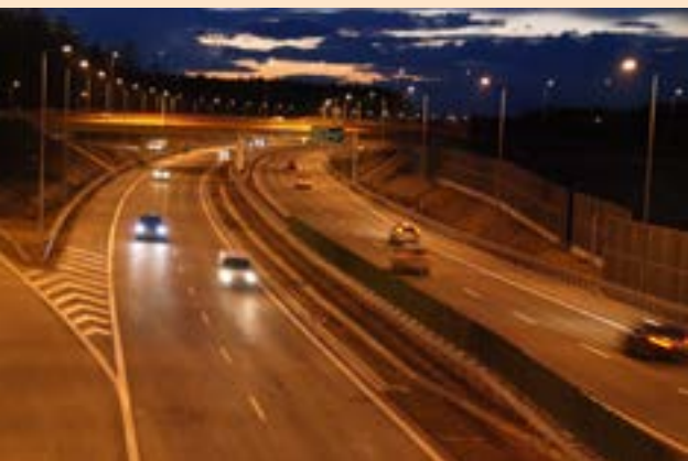
Brzesko to ważny węzeł autostradowy

podejmuje od lat jest Brzesko. Zarówno samorząd jak i mieszkańcy, wyróżnia spośród liczego grona podobnie przedsiębiorczych wiele atutów, które niezaprzeczalnie stawiają Brzesko w roli lidera. Tu od lat najważniejszy był tzw. dobry klimat do inwestowania. O przyjaznym nastawieniu do przedsiębiorców niech świadczą przyznawane ostatnio wyróżnienia jak chociażby Najwyższa Jakość Quality International