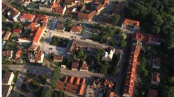
Rynek w Krzeszowicach

– tutaj warto: żyć, pracować, wypoczywać