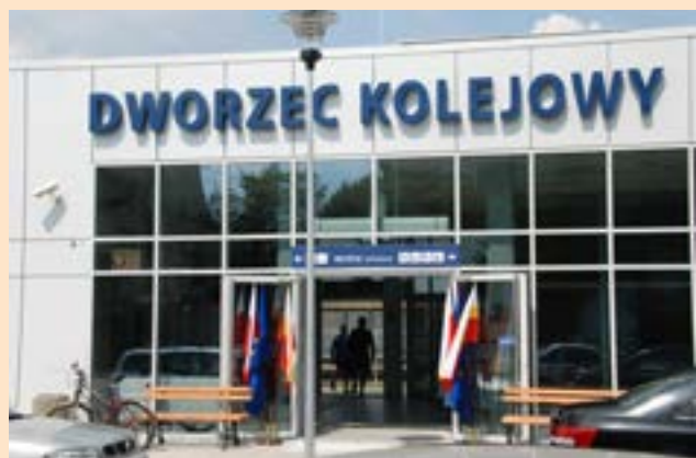
Wyremontowany dworzec PKP w Brzesku