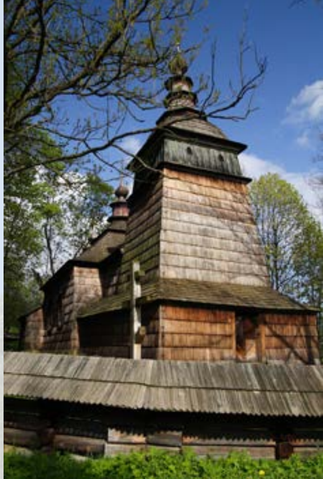
Bartne, cerkiew Świętych Kosmy i Damiana

Za szczególnie istotną należy uznać sprawę zarządzania. Wytyczony i oznakowany szlak nie znacznie żyć swoim własnym życiem. Wymaga ciągłego