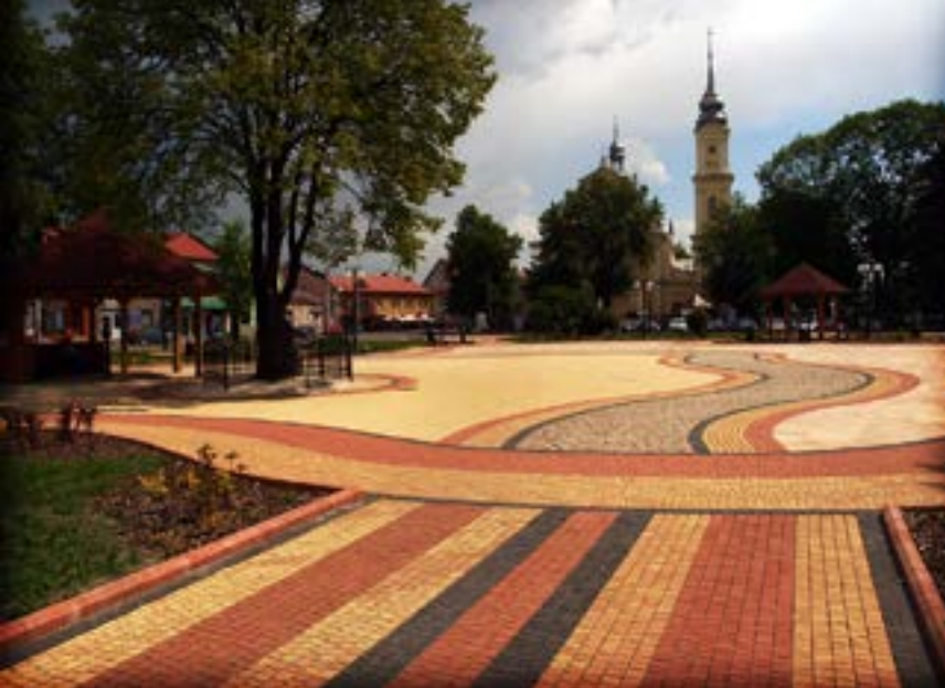
Odnowiony rynek w Szczucinie