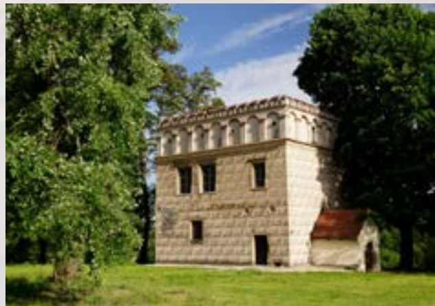
Branice, dwór obronny, tzw. lamus

Ważnym elementem projektu będzie stworzenie internetowej bazy danych polskich szlaków kulturowych. Baza będzie zawierała konkretne rekordy/ szlaki, opisane według wybranych kryteriów, jak: