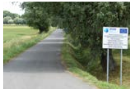
Droga po zabezpieczeniu azbestu