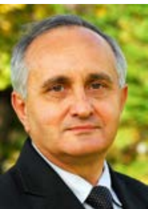
Starosta Gorlicki Karol Górski

Kompleksowa, nowoczesna i konkurencyjna jest oferta kształcenia zawodowego w Centrum Kształcenia Praktycznego i Ustawicznego w Gorlicach oraz w szkołach ponadgimnazjalnych prowadzonych przez powiat gorlicki. Samorząd powiatowy przez pięć lat gruntownie zmodernizował obiekty i rozwinął system edukacji zawodowej.