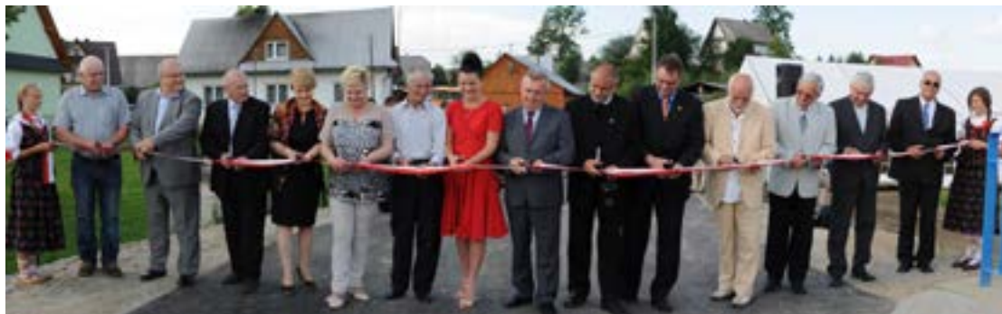
Otwarcie gminnych inwestycji

W trosce o zdrowie mieszkańców powstało wielofunkcyjne Orawskie Centrum Zdrowia. Jest ono największym ośrodkiem opieki zdrowotnej w Gminie Jabłonka. W obrębie ośrodka funkcjonuje kilka poradni (chirurgiczna, dla dzieci zdrowych i chorych, ginekologiczna, kardiologiczna, ortopedyczna, neurologiczna, stomatologiczna i poradnia lekarza podstawowej opieki zdrowotnej), jak również gabinety: położnej, medycyny szkolnej, a także pielęgniarki środowiskowo-rodzinnej. Od 2014 r. sprawowana jest tu całodobowa opieka medyczna.