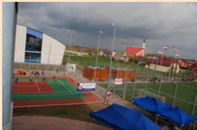
Kompleks sportowy Orlik i basen