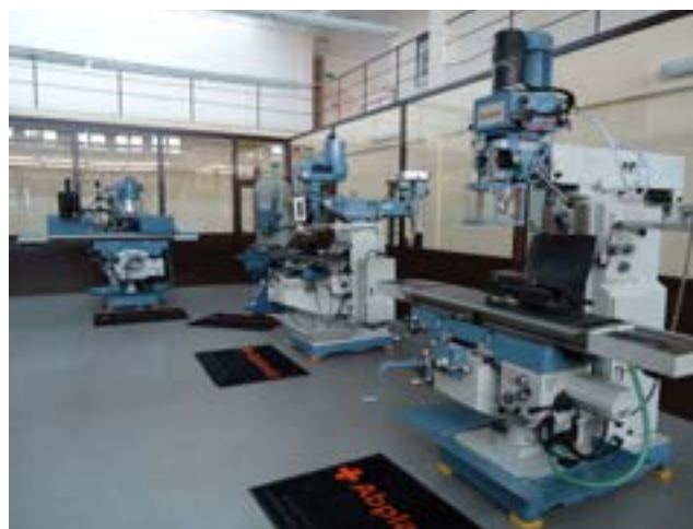
Nowocześnie wyposażone pracownie w CKPiU w Gorlicach