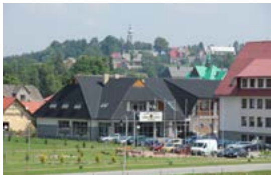
Orawskie Centrum Kultury