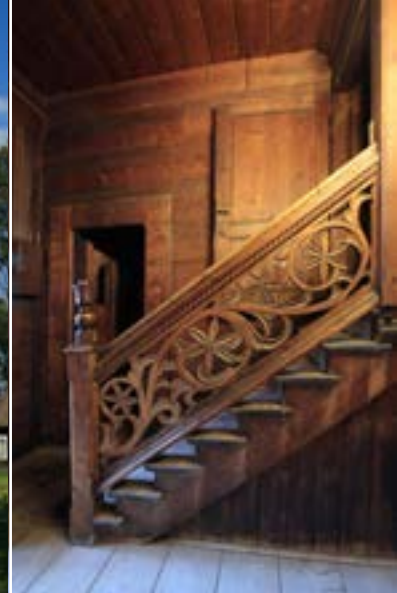
Łopuszna, dwór Tetmajerów