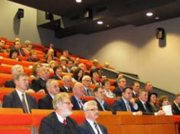
Otwarcie sali audiowizualnej w CKPiU w Gorlicach

3,9 mln zł. W Centrum utworzono 5 pracowni: 3 z branży samochodowej (diagnostyka pojazdów samochodowych, diagnostyka i naprawa silników samochodowych, naprawa blacharska pojazdów samochodowych) i 2 z mechanicznej (programowanie i obróbka z wykorzystaniem maszyn sterowanych numerycznie (CNC), obróbka skrawaniem – obrabiarki konwencjonalne). Uroczystość odbyła się w zabytkowej hali odlewni żeliwa, która 5 lat później „zamieniła się” w nowoczesną salę audiowizualną.