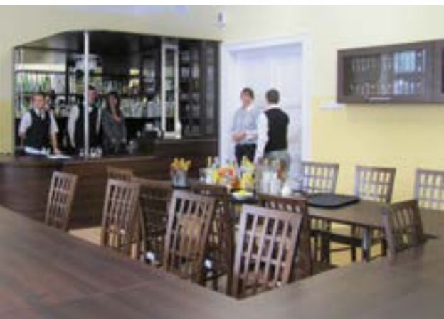
Pracownia barmańska w ZSZ w Gorlicach

W kolejnym projekcie systemowym w ramach Programu Operacyjnego Kapitał Ludzki Europejskiego Funduszu Społecznego pn. „Modernizacja kształcenia zawodowego w Małopolsce” o wartości 7,2 mln zł Centrum dorobiło się nowych pracowni: maszyn, aparatów i urządzeń elektrycznych, elektrotechniki