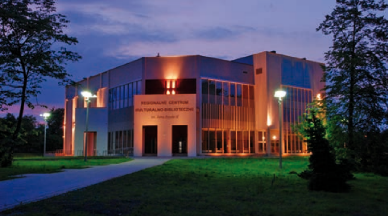
Regionalne Centrum Kulturalno-Biblioteczne

2012. Brzeski samorząd wie, że to co najbardziej zachęci inwestora to m.in. odpowiedź na pytanie na czym i ile może on zarobić. Ważna jest też dostępność do wysoko wykwalifikowanej kadry. W brzeskich szkołach kształcenie zawodowe jest dostosowane do potrzeb rynku pracy. Ale potencjalni inwestorzy chcą też gminy atrakcyjnej, z zapleczem rozrywkowym, sportowym, kulturalnym, z bazą gastronomiczno-hotelową stojącą na najwyższym poziomie. Tutaj też Brzesko ma bardzo dobrze rozwiniętą infrastrukturę spędzania wolnego czasu. Nowoczesna kryta pływalnia, kręgielnia, bowling, centrum kulturalno-biblioteczne, kino 3D, boiska Orlik, łowiska dla wędkarzy, piękne tereny do wędrowek czy wreszcie wysmienita kuchnia w restauracjach i zajazdach, to wszystko czyni z Brzeska miejsce o wyjątkowym klimacie, przyjaznym najbardziej wysublimowanym