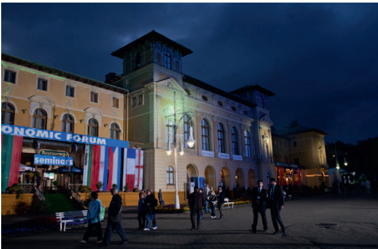
Stary Dom Zdrojowy w Krynicy

Forum Inwestycyjne Forum Ekonomicznego zorganizowane w ubiegłym roku już po raz trzeci udowodniło, że jest niezbędnym uzupełnieniem krynickiego spotkania świata polityki i biznesu. Przewodnimi tematami ubiegłorocznego spotkania w Tarnobrzegu były wielkie prywatyzacje, inwestycje jako środek przezwyciężenia kryzysu ekonomicznego, problemy sektora chemicznego w Europie Środkowo-Wschodniej, kwestia powstania nowego centrum finansowego w regionie. Na Forum gościliśmy m.in. przedstawicieli Ministerstwa Azerbejdżanu, Kirgistanu, Ukrainy, Białorusi, Łotwy. Nie zabrakło reprezentacji przedstawicieli biznesu polskiego, węgierskiego, przedsiębiorców prowadzących szeroko rozumianą działalność w państwach Europy Środkowo-Wschodniej. Honorowym Patronem wydarzenia był Aleksander Grad, Minister Skarbu Państwa, który drugiego dnia Forum, wygłosił krótkie oświadczenie na temat klimatu inwestycyjnego w Polsce, potencjału inwestycyjnego jaki ma w swej ofercie ministerstwo Skarbu Państwa.