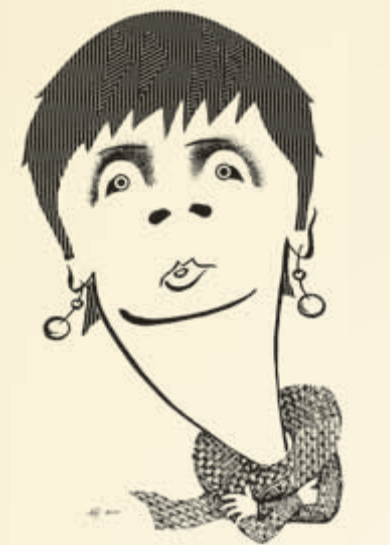
Janina Ochojska Człowiek Roku 2010

w uznaniu zasług w szerzeniu idei solidarności międzyludzkiej – często przekraczającej granice państw i naszych słabości