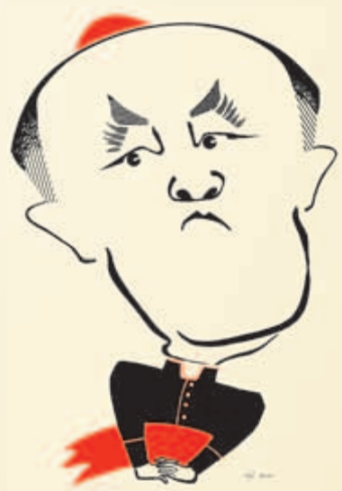
kard. Kazimierz Nycz Małopolanin Roku 2010

w uznaniu za wybitne kreacje teatralne i filmowe oraz wieloletnią działalność charytatywną na rzecz chorych, niepełnosprawnych i pokrzywdzonych i w podzięcie, że pomagają nam w sobie budzić dobro