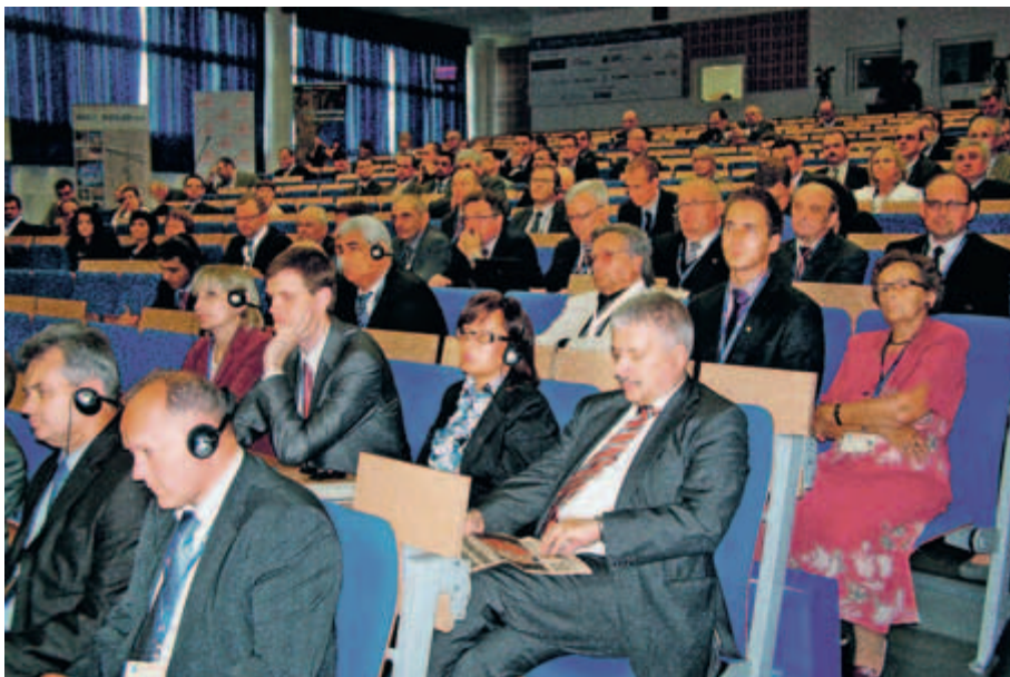
Obrady IV Forum Inwestycyjnego w Tarnobrzegu