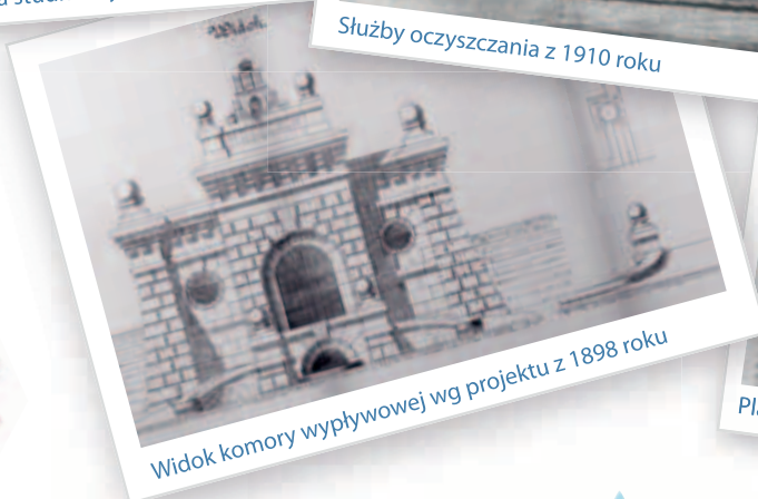
Widok komory wypływowej wg projektu z 1898 roku