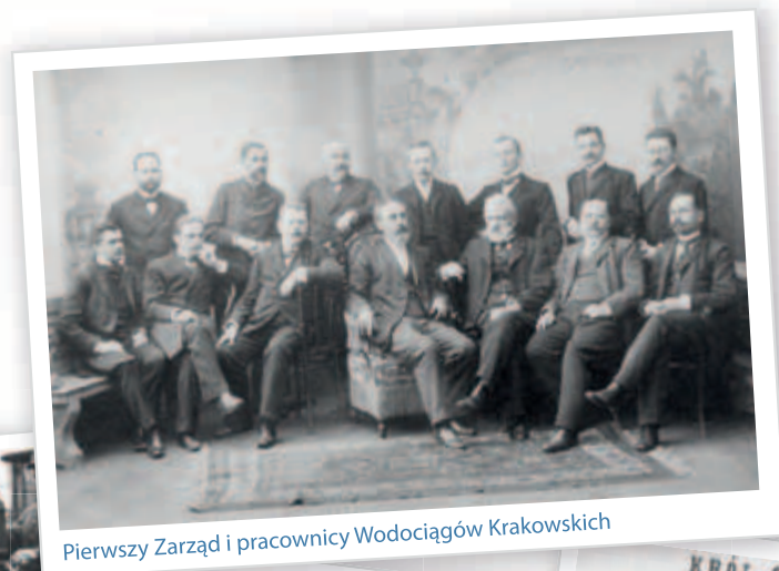
Pierwszy Zarząd i pracownicy Wodociągów Krakowskich