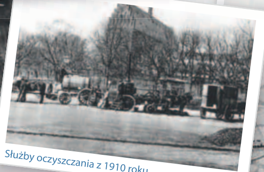
Służby oczyszczania z 1910 roku