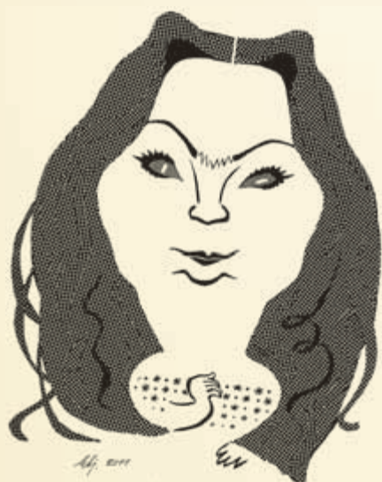
Anna Dymna Małopolanin Roku 2010

w uznaniu za wybitne kreacje teatralne i filmowe oraz wieloletnią działalność charytatywną na rzecz chorych, niepełnosprawnych i pokrzywdzonych i w podzięcie, że pomagają nam w sobie budzić dobro