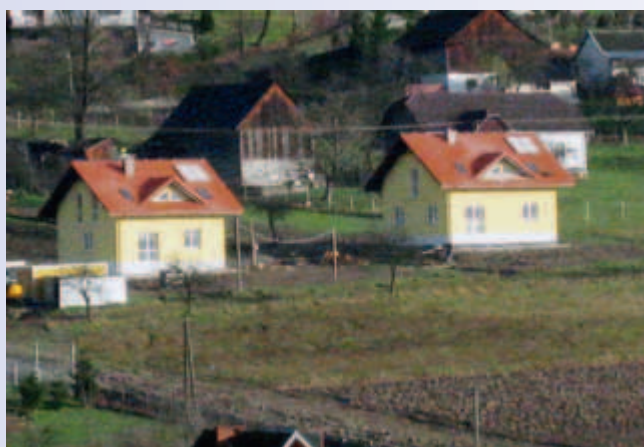
Nowe domy dla poszkodowanych

W jednej chwili gmina stała przed dwoma wielkimi wyzwaniami: zapewnieniem poszkodowanym dachu nad głową i rekultywacją osuwiska. Powstał zespół zadaniowy, dzięki któremu niemal od razu udało się rozlokować ewakuowanych, jeśli nie w rodzinach i wśród znajomych, to w zespole szkół w Męcynie.