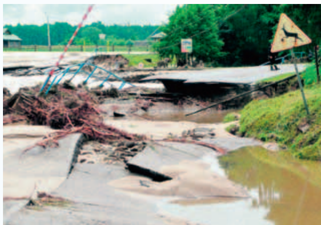
Wieś Narożniki na Powiślu Dąbrowskim podczas powodzi w 2010 r.