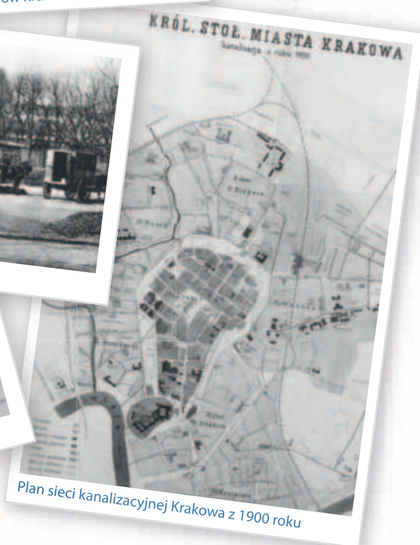
Plan sieci kanalizacyjnej Krakowa z 1900 roku