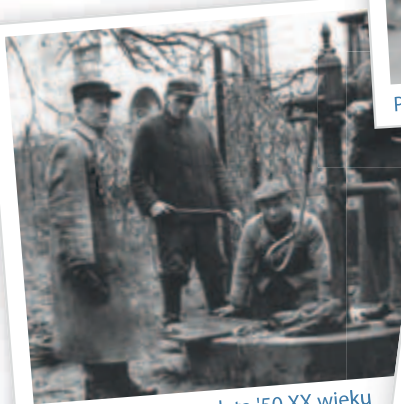
Brygada studniarzy lata '50 XX wieku