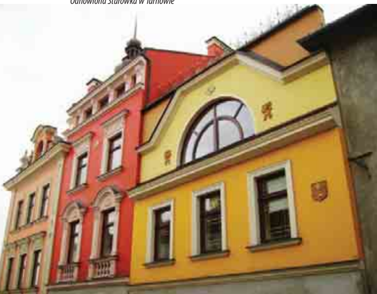
Odnowiona Starówka w Tarnowie

Katalog beneficjentów działania 6.1 określa Uszczegółowienie Małopolskiego Regionalnego Programu Operacyjnego na lata 2007 – 2013 przyjęte przez Instytucję Zarządzającą programem, czyli Zarząd Województwa Małopolskiego. Są nimi: jednostki samorządu terytorialnego i ich jednostki organizacyjne, administracja rządowa, instytucje kultury, osoby fizyczne i prawne będące organami prowadzącymi szkoły i placówki, kościoły