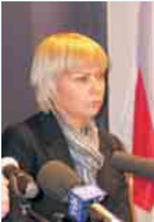
Elżbieta Bieńkowska, Minister Rozwoju Regionalnego