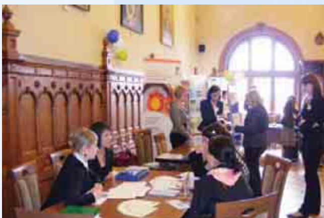
Stoiska informacyjne podczas I Małopolskich Targów Funduszy Europejskich

Wydawca: Stowarzyszenie Gmin i Powiatów Małopolski, ul. Grodzka 28, 31-004 Kraków, tel./fax 0 12 421 93 12