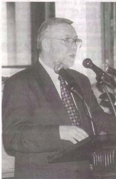
Senator Jerzy Stępień

Zespół d/s samorządu Fundacji Instytutu Lecha Wałęsy, 90-062 Łódź, ul. Piotrkowska 133, tel 042/ 36 17 49