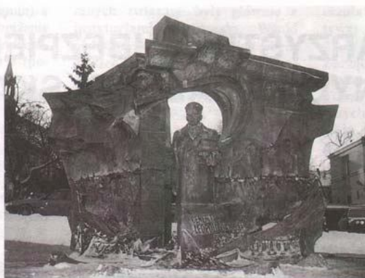
Pomnik Okulickiego w Bochni

Wyznaczono mu nową conajmniej równie trudną placówkę – zo-