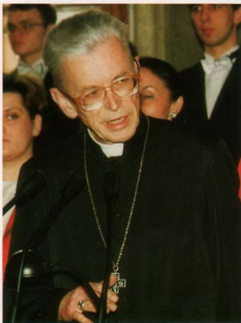
Przemówienie JE Franciszka Kardynała Macharskiego