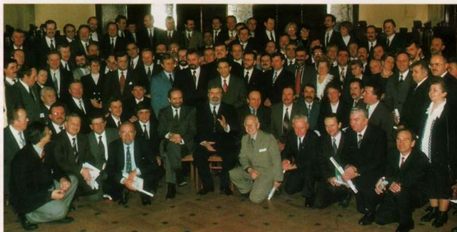
Prezydent, Burmistrzowie, Wójtowie i Radni Malopolskich Miast i Gmin