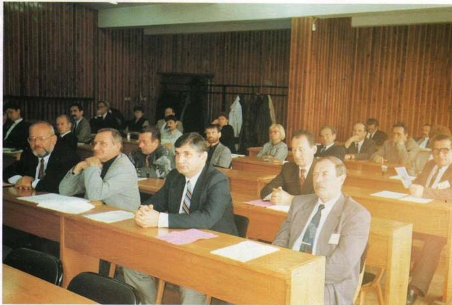
I Małopolska Konferencja Samorządowa. Zakopane 27-29.09.1996.