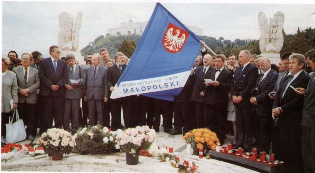
Nieodłączną częścią pielgrzymki była wizyta na Polskim Cmentarzu Wojskowym na Monte Cassino

Pragnę wyrazić głębokie uznanie dla wszystkich wysiłków podejmowanych przez Samorządy Małopolski, a zmierzające ku obronie godności osoby ludzkiej i ponadczasowych wartości, które w tym regionie Polski są bardzo mocno zakorzenione. Staram się z uwagą śledzić te działania i są mi one znane. Dziękuję za wasz wkład w rozwój rodzimej kultury i zachowanie w niej tego co tysiącletnia, chrześcijańska tradycja do