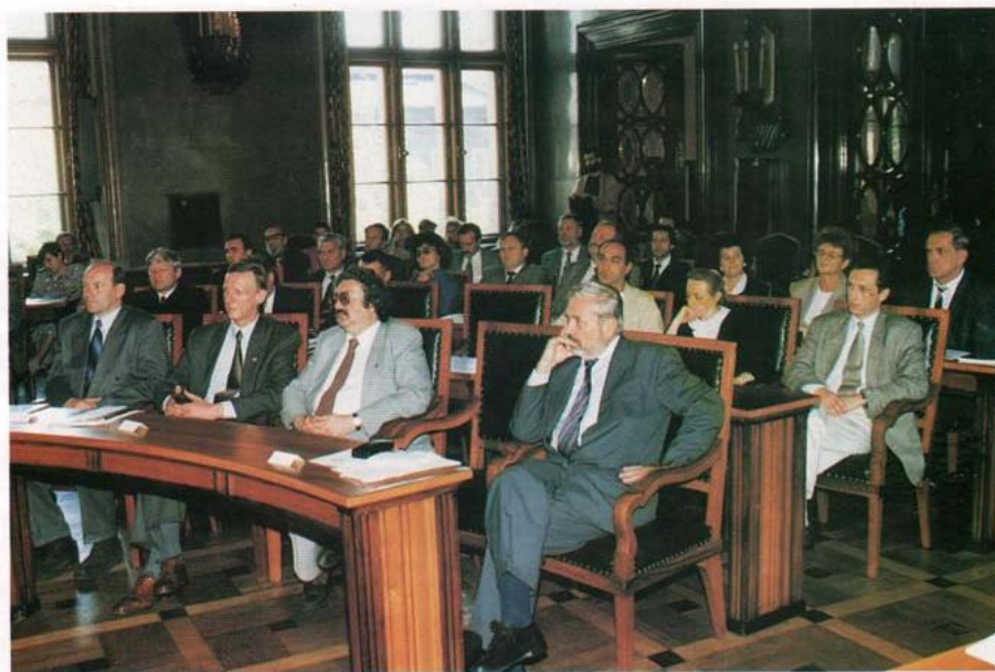
VII Walne Zgromadzenie Delegatów SGM. Kraków, 31.05.1996.