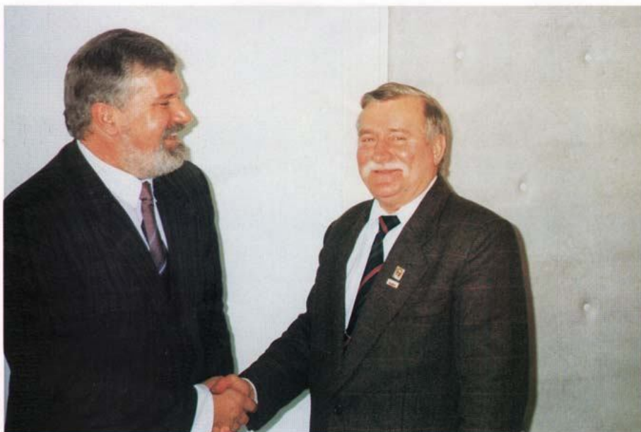
Wizyta Prezydenta RP Lecha Wałęsy w siedzibie Stowarzyszenia Gmin Małopolski. 4.10.1996.