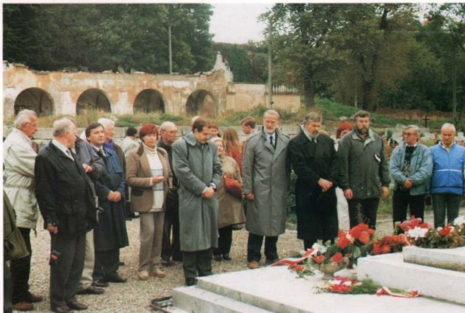
Wizyta Delegacji Miasta Krakowa we Lwowie. Złożenie kwiatów na Cmentarzu Orłąt Lwowskich. 21.10.1996.