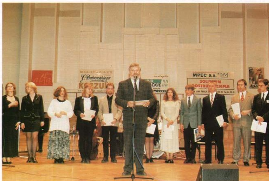
Krakowski finał "Konkursu 8 Wspaniałych".