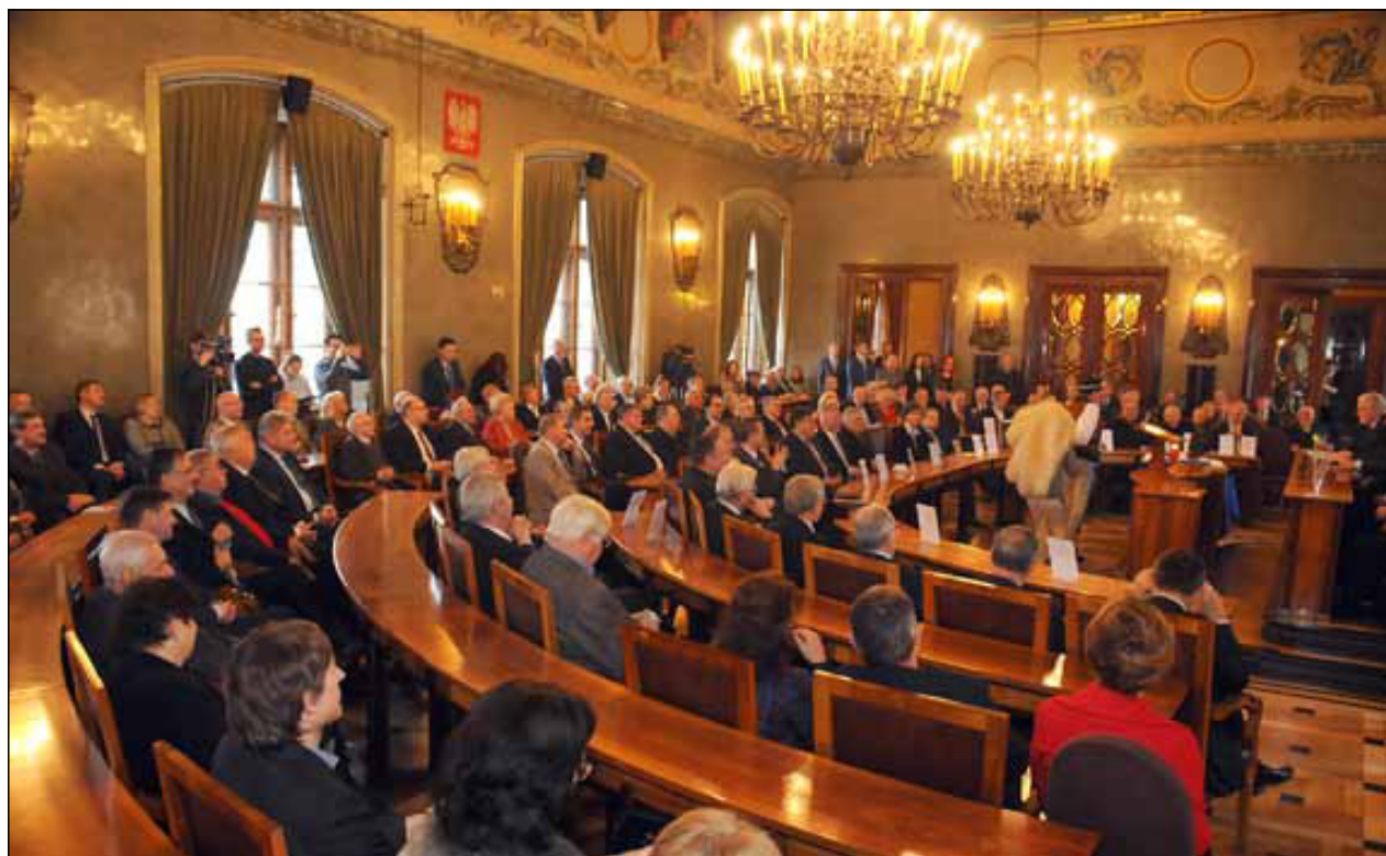
Noworoczne spotkanie samorządów Małopolski i Polski w sali obrad RMK.