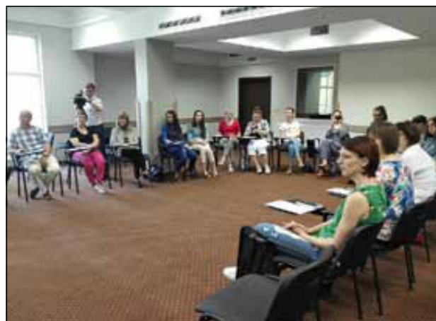
Uczestnicy szkolenia we Lwowie

zasady nawiązywania i zarządzania partnerstwami z organizacjami z Polski.