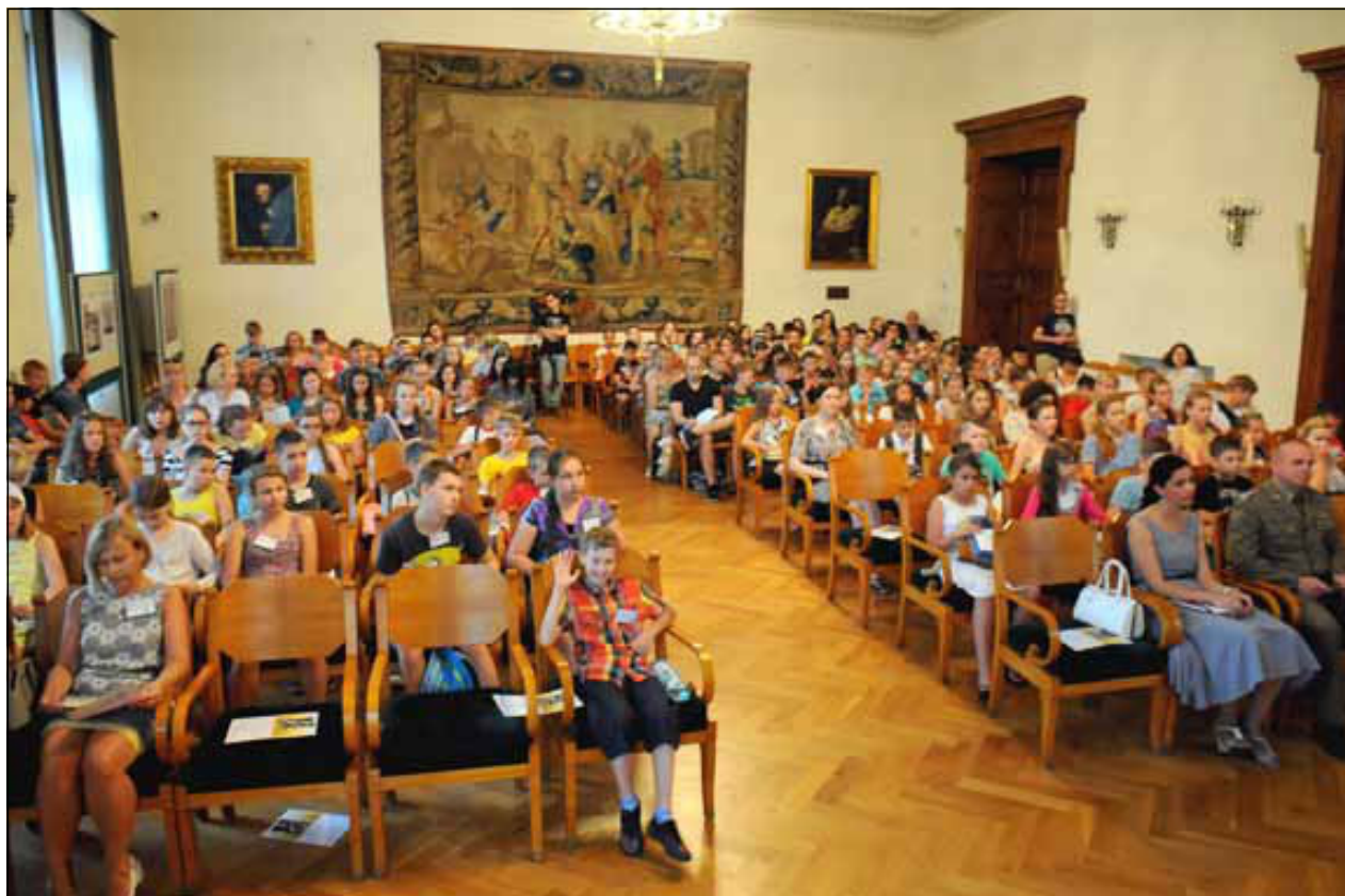
Szacowna Aula PAU chyba dawno nie gościła tak młodego i sympatycznego audytorium 170 dzieci uczestniczących w XVII Akcji SGiPM „Podarujmy Lato Dzieciom Ze Wschodu”.

wanym przez ministerstwo środowiska. W stanowisku SGiPM z 21 czerwca czytamy: „Szczególny niepokój budzi wdrażanie art. 9 Ramowej Dyrektywy Wodnej, który dotyczy pełnego zwrotu kosztów usług wodnych. Fakt, że funkcjonujące obecnie w Polsce niskie ceny za pobieraną wodę nie zachęcają do zrównoważonego gospodarowania jej zasobami, to jednak zaproponowane przez ministerstwo środowiska w projekcie ustawy nowe ceny, szczególnie za korzystanie z wód w gospodarce komunalnej, przemysłowej i rolnictwie w naszej opinii są radykalnie wielokrotnie za wysokie.”