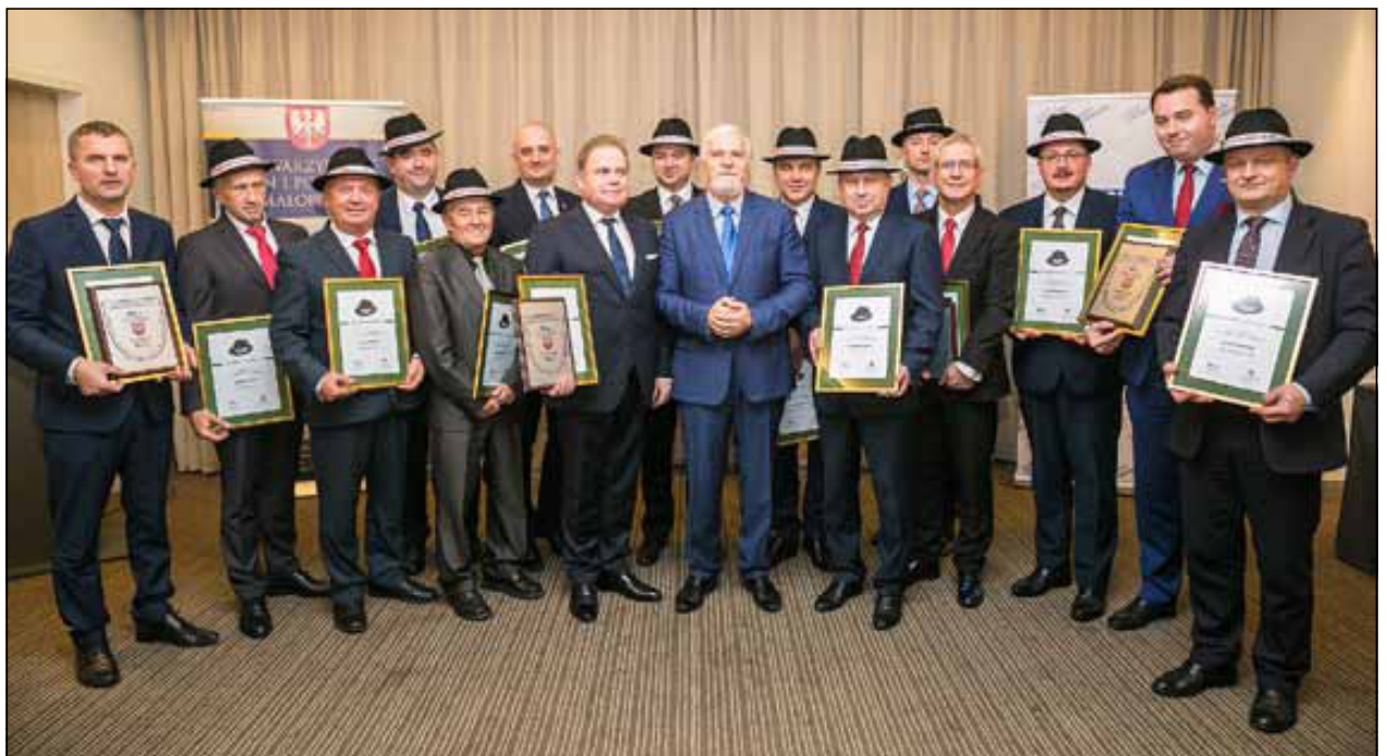
Zwycięscy burmistrzowie i wójtowie z przewodniczącym Stowarzyszenia, wręczającym Witosowe Kapelusze.

3 września odbył się kolejny „Dzień Otwarty w Telewizji Kraków”. Tegoroczne wydarzenie związane było z obchodami trzech rocznic: jubileuszu 55-lecia Telewizji Kraków, 50-lecia istnienia „Kroniki Krakowskiej”, no i oczywiście 25-lecia powstania Stowarzyszenia Gmin i Powiatów Małopolski. Jednym z elementów programu był plebiscyt telewidzów nazywany „Telewizja od Kuchni”, czyli III Konkurs Małopolskich Potraw i Wyrobów Regionalnych brało udział około 60 potraw z różnych zakątków Małopolski i wszystkie były równie smaczne. Ostatecznie wygrały jednak orzeszki zawilskie – słodkie ciasteczka z nadzieniem nugatowym, które przygotowało Koło Gospodyń Wiejskich z Kasinki Małej. Specjał ten został ogłoszony zwycięzcą III Kon-