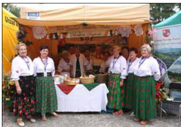
Stoisko zwycięskiej ekipy Koła Gospodyń Wiejskich Kasinka Mała reprezentującego gminę Mszana Dolna na III Konkursie Małopolskich Potraw i Wyrobnów Regionalnych.