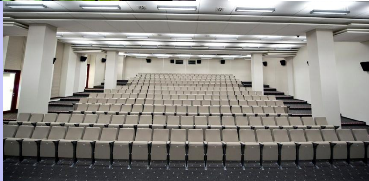
Sala Audytorijna – widownia 3