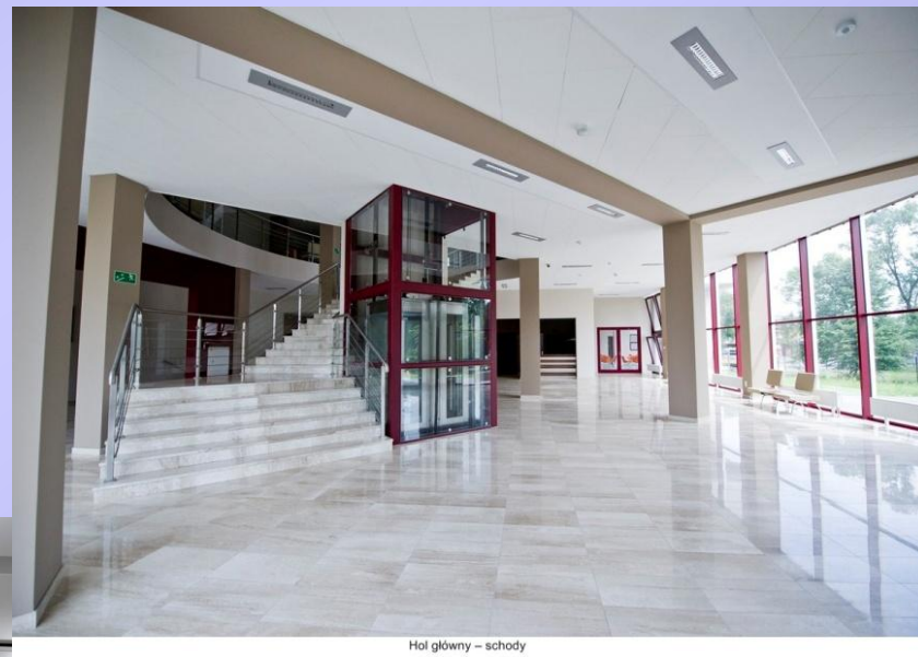
Hol główny – schody