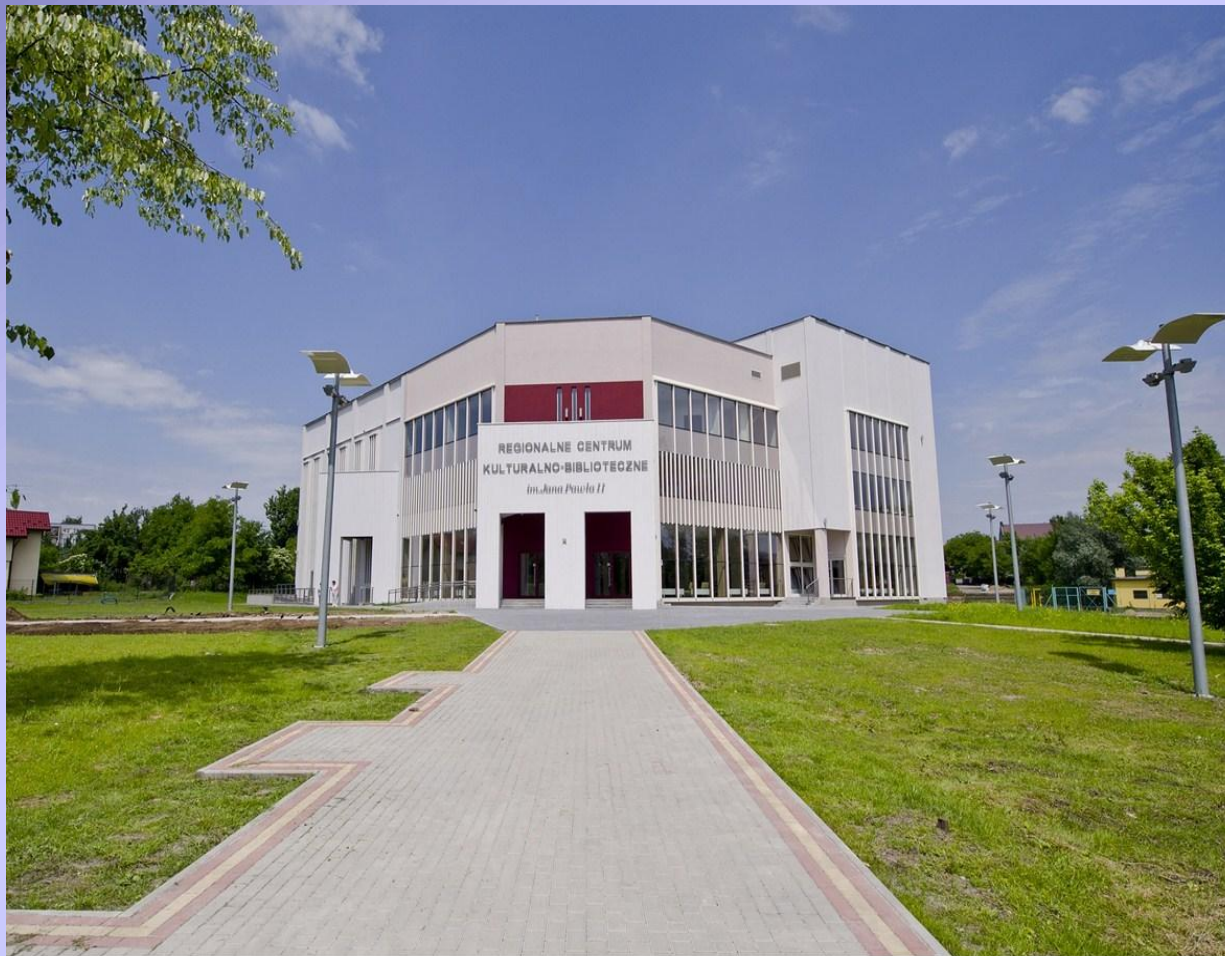
Regionalne Centrum Kulturalno-Biblioteczne – w otoczeniu parku